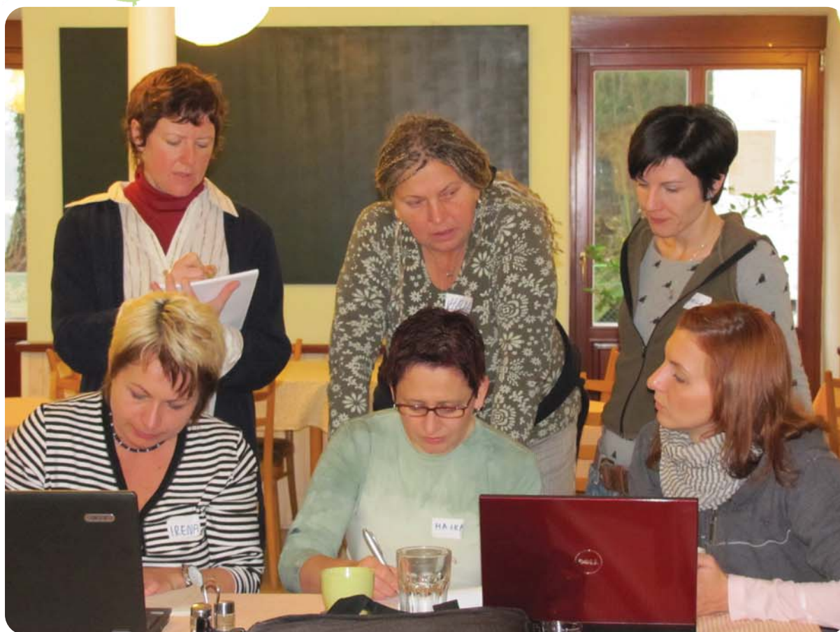
Účastníci workshopu pracují na zadaném úkolu jaro 2011

MATURUS, o.p.s. Nadace Proměny Nadace Veronika Nadace Via Nadační fond Mikrofinance Nadační fond obětem holocaustu Nebelvír, o.s. Občanské poradenské středisko Občanské sdružení Dítě s diabetem PROSTOR PRO, o.s. Proxima Sociale Sananim, o.s. Sdružení pro integraci a migraci Slow Food Prague